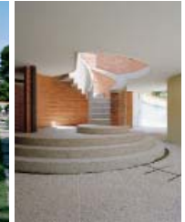
MARCELLO D'OLIVO: SOMMERHAUS, LIGNANO PINETA, 1954–55