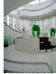
NANDA VIGO: CASA MUSEO REMO BRINDISI, LIDO DI SPINA, 1967–71