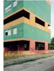
GINO VALLE: WOHNBLOCK, UDINE, 1976–79