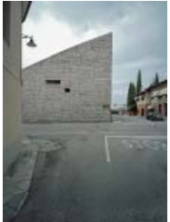
GRESLERI, VARNIER: RATHAUS, ARBA, 1967–73