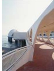
ALDO BERNARDIS: TERRAZZA A MARE, LIGNANO SABBIAADORO, 1969–72