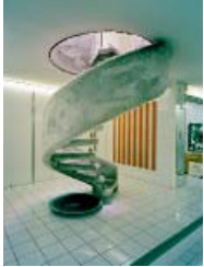
PONTI, VIGO: CASA SOTTO UNA FOGLIA, MALO, 1964–69