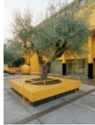
CAPPAL, MAINARDIS: CASA GIALLA, MIRA, 1967–69