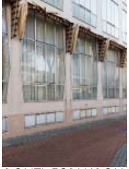
PONTI, FORNAROLI, ROSSELLI: FONDAZIONE GARZANTI, FORLÌ, 1953–57