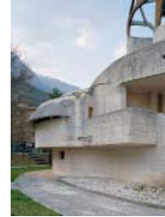
GIOVANNI MICHELUCCI: GEDÄCHTNISKIRCHE, LONGARONE, 1966–78