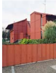
GINO VALLE: CASA ROSSA, UDINE, 1965–66