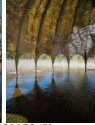
FILIPPO MONTI: WOODPECKER, MILANO MARITTIMA, 1967–68