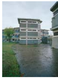
PORTOGHESI, ABRUZZINI: COLONIA ENPAS, CESENATICO, 1961–66