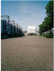
ANGELO MANGIAROTTI: MÖBELFABRIK SNAIDERO, MAJANO, 1976–78