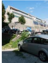
DINO TAMBURINI: KUNSTSCHULE, TRIEST, 1975