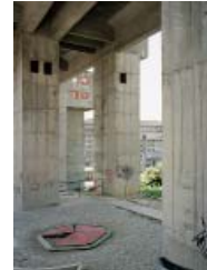
CELLI, TOGNON: WOHNQUARTIER RÓZZOL MELARA, TRIEST, 1970–83