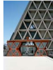
GUACCI, MUSMECI: VOTIVKIRCHE, MONTE GRISA, TRIEST, 1959–66