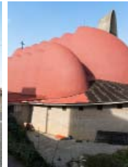
DINO TAMBURINI: SAN LUIGI GONZAGA, TRIEST, 1954–60